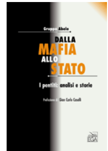
Dalla mafia allo stato I pentiti analisi e storie Prefazione di Giancarlo Caselli EGA editore www.egalibri.it